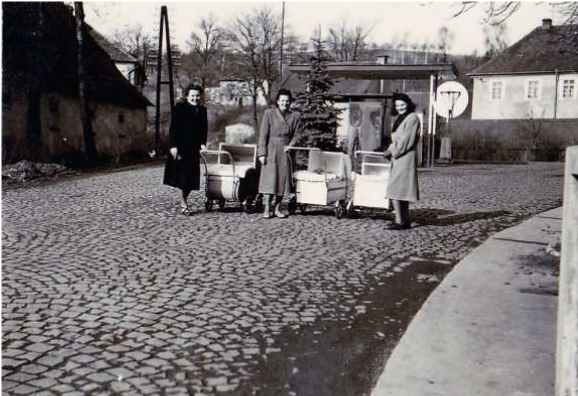
Pohled na benzínku z druhé strany