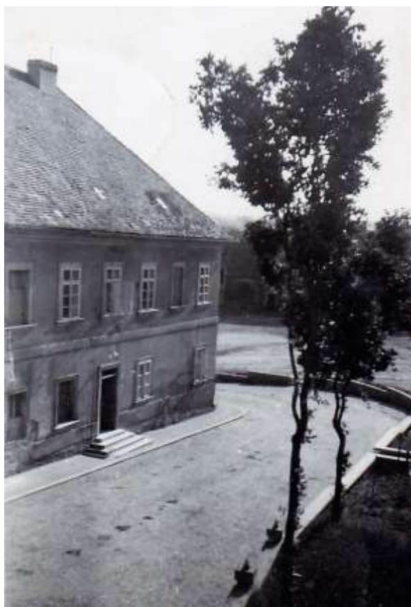
Hlavní pivovarská budova zezadu