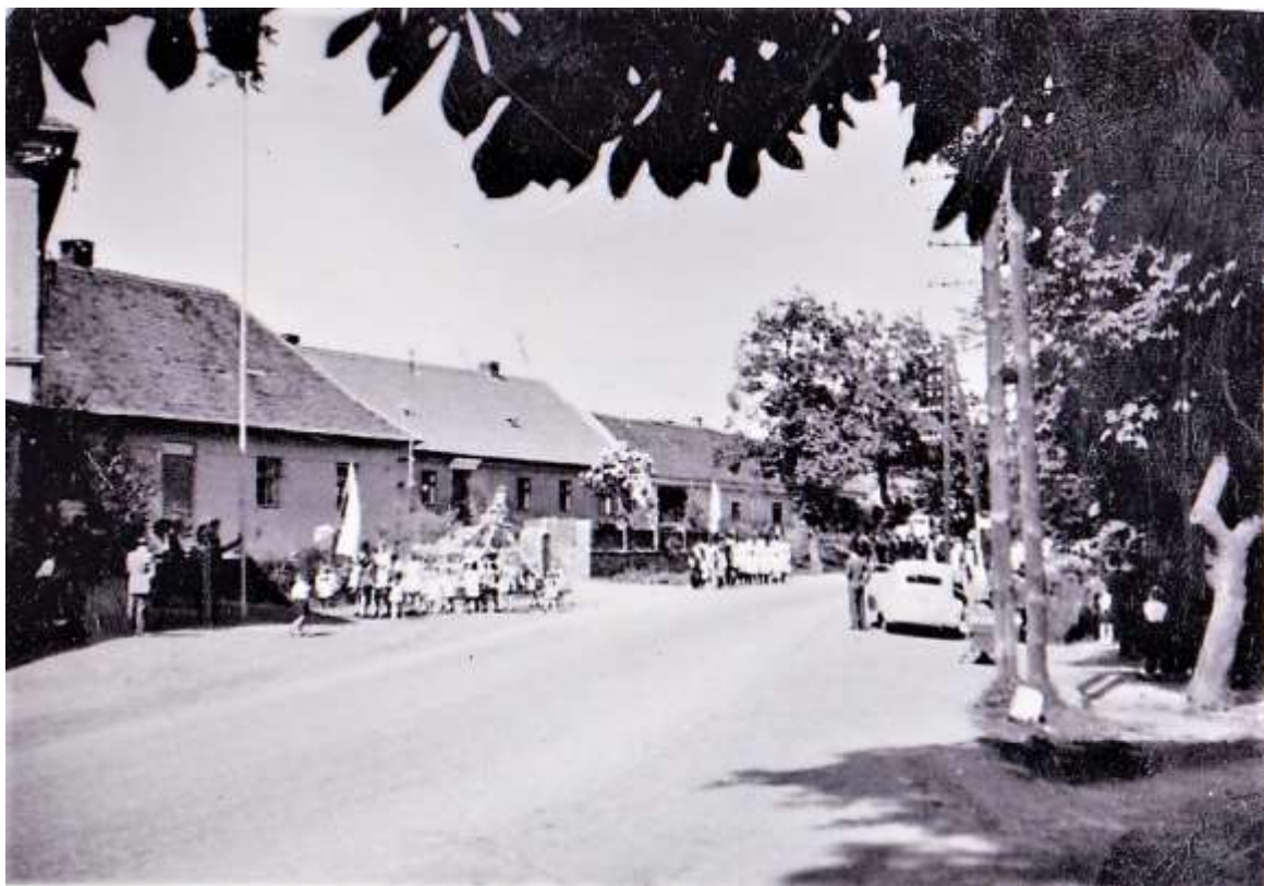
Jiný pohled na krušovické máje na karlovarské silnici