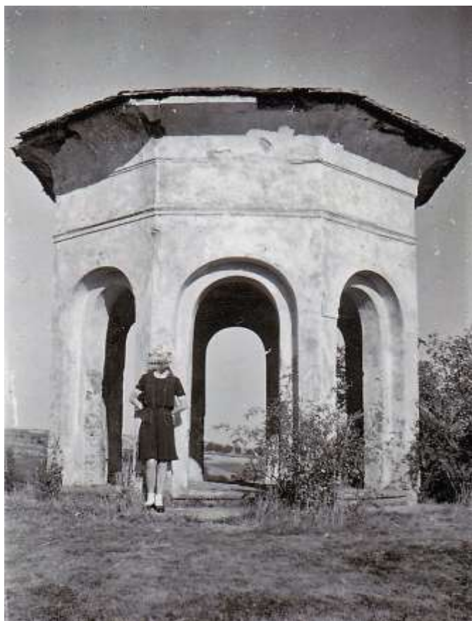
Altánek na Amálii v době, kdy bylo vidět do všech stran