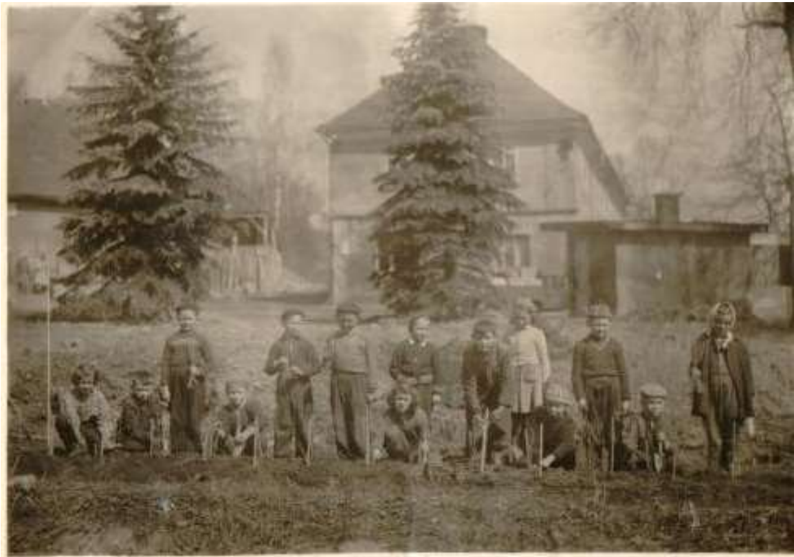
Výsadba moruší u potoka

Krušovický zpravodaj vydává na své náklady Obec Krušovice. Počet výtisků 220 ks, v elektronické podobě na stránkách www.obec-krusovice.cz . Adresa pro zaslání příspěvků obeckrusovice@seznam.cz . Obec Krušovice si vyhrazuje právo na úpravu zasláního textu.