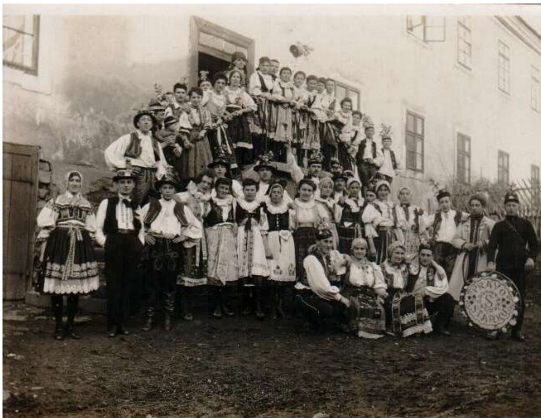
Takhle vypadaly krušovické máje před hospodou U Topinků

(za poskytnuté fotografie děkujeme paní Černé a panu de Finovi)