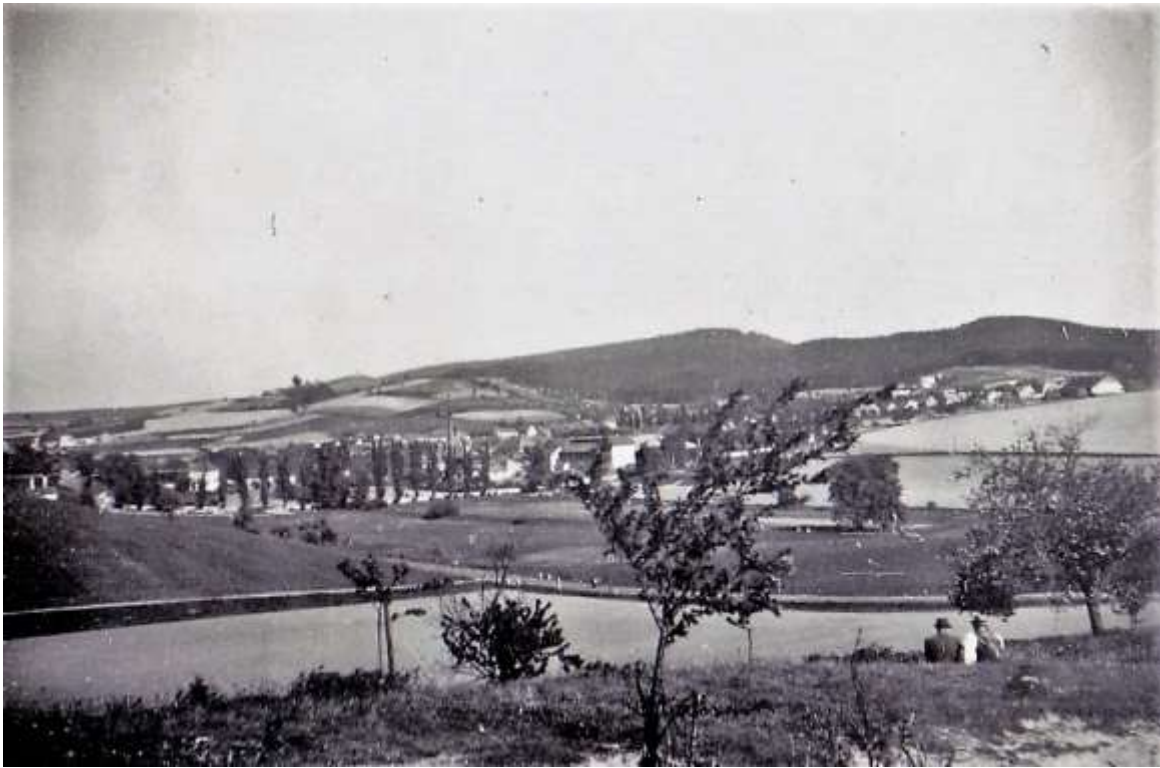
Pohled na Krušovice ze severozápadu